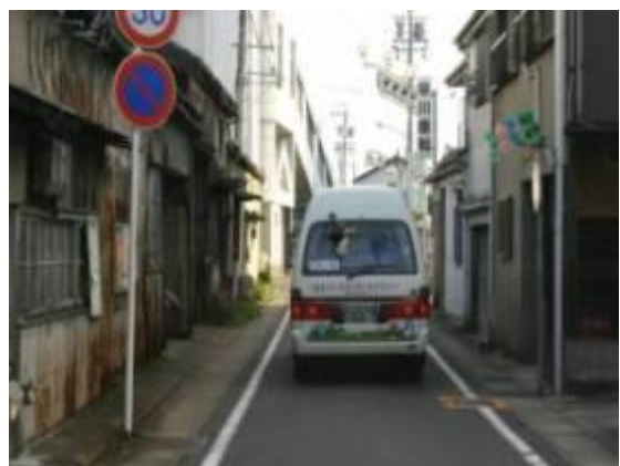
③細い道に入ります。