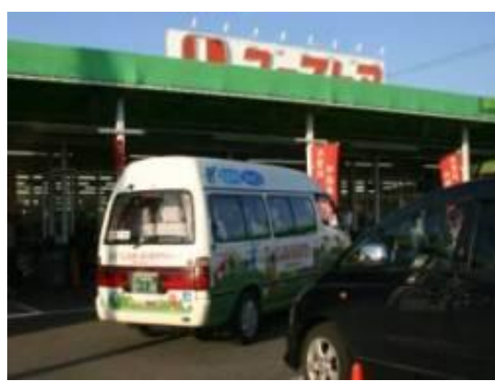
④スーパーマーケットの玄関脇まで入っていく。