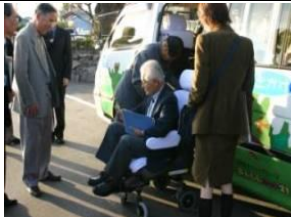
②電動で座席が出て、乗りやすくなります。タクシー運転手が介助します。