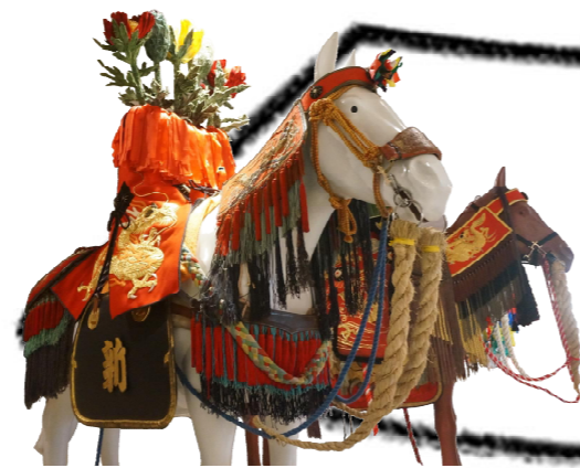
▲尾張旭市の馬の塔

1800年ほど前の竪穴住居から見つかった道具や、古墳からみつかったもの、城跡から見つかったものなどを展示しています。