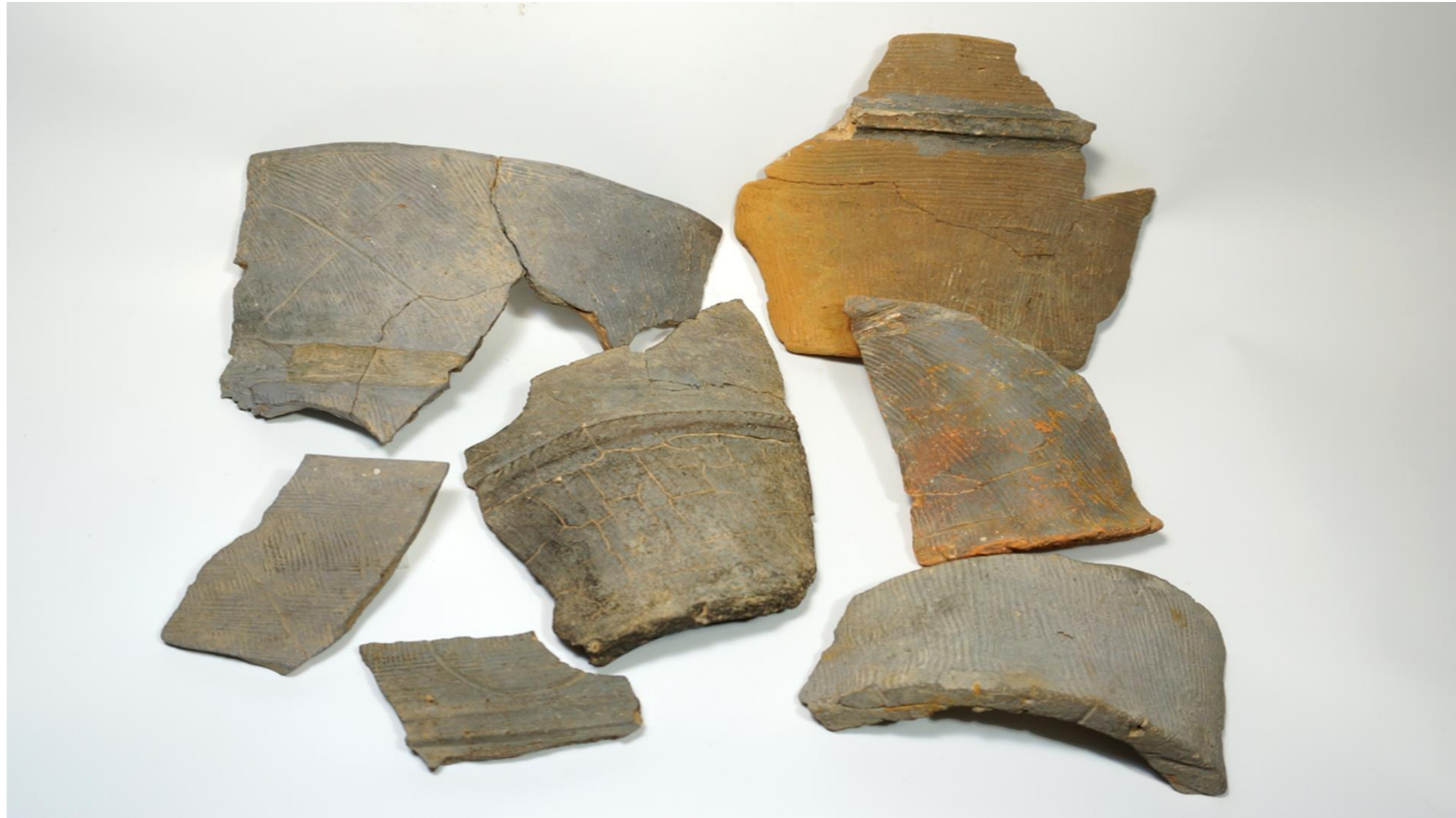
▲城山古窯出土 埴輪（しろやまこようしゅつど はにわ）