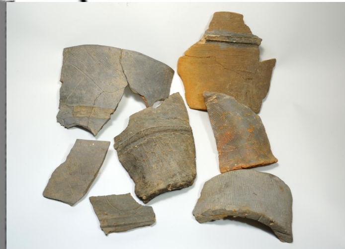
▲城山古窯出土 埴輪

1800年ほど前の竪穴住居から見つかった道具や、古墳からみつかったもの、城跡から見つかったものなどを展示しています。