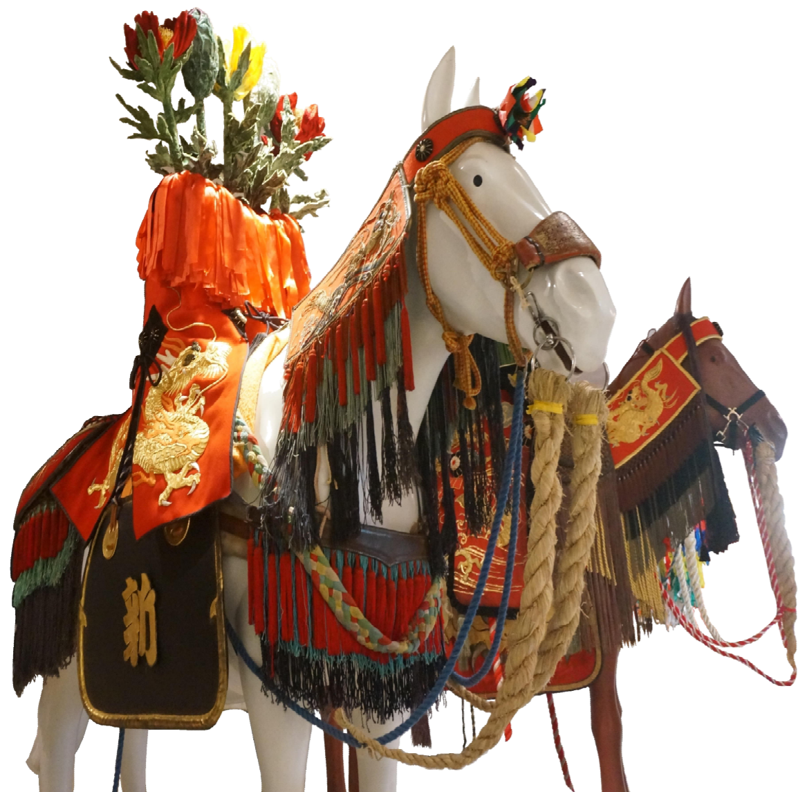
▲尾張旭市の馬の塔（新居地区）