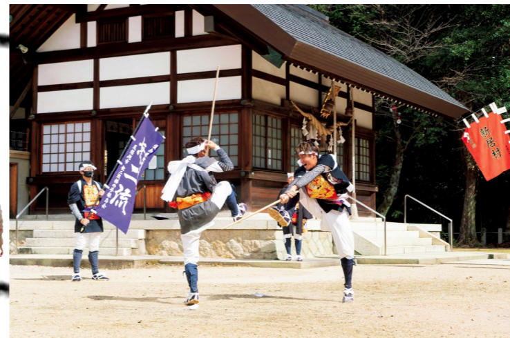
▼尾張旭市の棒の手