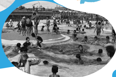
オープン当時の様子 (1979年)