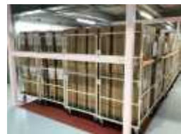
ロールボックスパレット