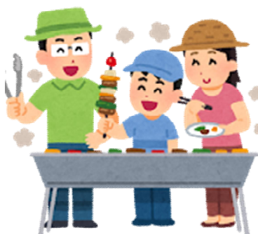
(家族のきずな・明るい家庭)