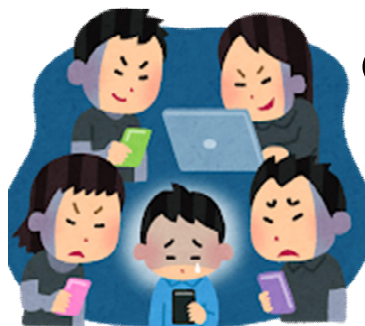
(SNSのいじめ・嫌がらせ)