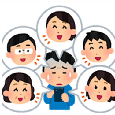
(SNSの使用方法について)