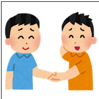
(友だちとのやりとり・関わり)