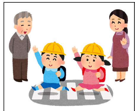
(地域や社会との関わり)