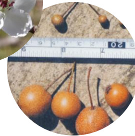
マメナシの実(上)と アイナシの実(下)

尾張旭市には、絶滅危惧種である「マメナシ」と、マメナシとナシの自然雑種で貴重な植物である「アイナシ」が自生している市指定文化財の「長池のマメナシ・アイナシ自生地」があります。マメナツシーとアイナツシーはマメナシとアイナシのイメージキャラクターです。